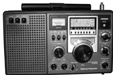
'70年代 BCLブームの頃の短波ラジオ

手始めに、60～70年代を中心としたシドニーのオールディーズ専門局「EASY1170」、出力の小さなコミュニティラジオながらジャズを専門としているゴールドコーストの「JAZZ Radio」をお勧めします。“日本の秋の夜長”に“春を迎えるオーストラリア”の生放送に耳を傾けてはいかがでしょうか。