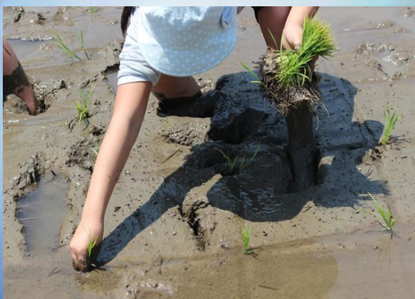
思うように動けない田んぼにも、慣れてきた様子の子も達！！頑張れ～♪