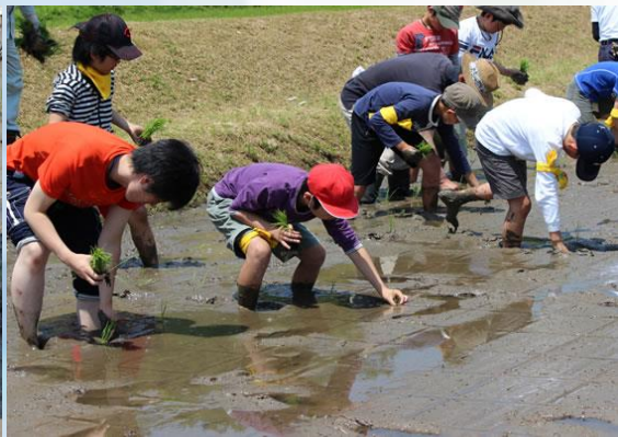
初めての田んぼに恐る恐る入っていく子ども達。田んぼの感触に子どもたちもびっくり！足がなかなか抜けず…苦戦している様子でした。