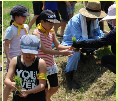
苗を1人ずつもらい、一列に並んで、いざ田んぼの中へ！！