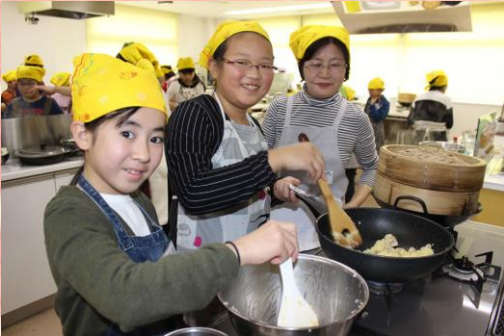
みんなとっても楽しそう♪