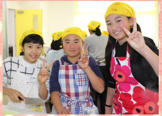
シュウマイを包むのは結構難しいけど・・・班のお友達との作業に、自然と笑みがこぼれます。みんなで話しながら作るから、更に楽しいね♪