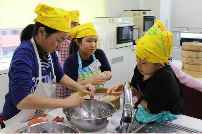
炒飯がパラパラに仕上がるコツを実践！！たまごとご飯をまぜまぜ～♪それから、炒める作業に入ります。