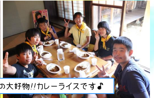
お昼は『汐待亭』にて、みんなの大好物!!カレーライスです♪