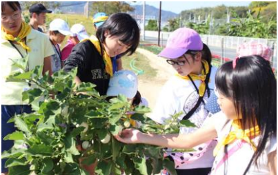
万田酵素の「びっくりファーム」を見学。大きく、おいしく育った野菜を観察しました！！