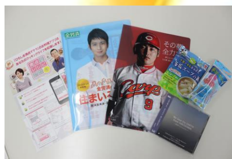
全労済からリーフレット・クリアファイル、もみじ銀行からクリアファイル、金冠堂からASSYフットケミスト、ますやみそから冬瓜スープの素のプレゼントがありました！！