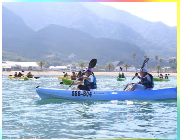
瀬戸田サンセットビーチでは、シーカヤックや柑橘ジュース搾りを体験した子どもたち！！楽しい体験に、みんな笑顔です♪